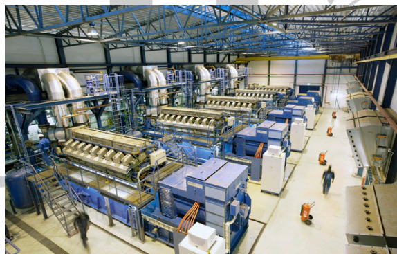
شکل ۱. کارگاه صنعتی

همچنین نمونه ای از یک جدول به صورت زیر است.